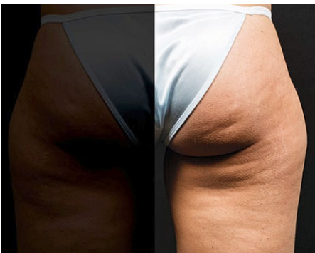
Vor der Behandlung Diäten und Fitnesstraining helfen nur beschränkt.

Der Effekt ist allerdings nicht sofort sichtbar, da die abgestorbenen Fettzellen erst aus dem Körper transportiert werden müssen. Das definitive Resultat stellt sich erst nach sechs bis acht Wochen ein. ●