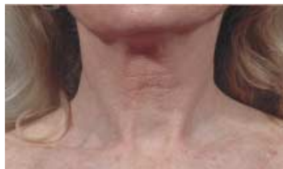
Abbildung 4: Rejuvenation von Hals und Dekolleté vor und nach drei Fraxel-Laser-Sitzungen (Dr. J. Burns)